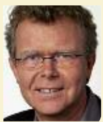
Rainder Steenblock, europapolitischer Sprecher Bündnis 90/Die Grünen

Ohio besuchte ich Wahllokale, sprach mit US-Experten, Regierungsvertretern und Wählern und erlebte Barack Obama aus nächster Nähe. Insgesamt sind die Wahlen demokratisch, frei und transparent verlaufen. Die